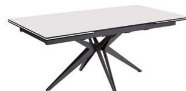
PIEDS ÉPINGLE EN CROIX