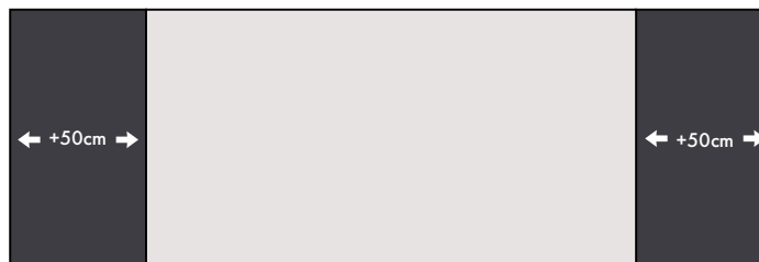
Plateau de 180 cm + 2 allonges en bout escamotables de 50 cm