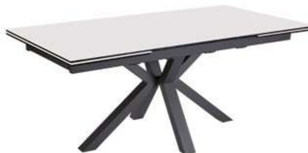
PIEDS EN CROIX